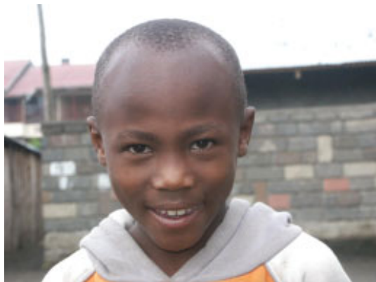
En af drengene fra drengehjemmet

På New Life Girls House bor der nu 44 piger, hvor den yngste for tiden er 8 år. Der er også mange teenagere, men mange er på gymnasiet, så de kun er hjemme i ferien. Her i pigehuset er der meget trangt. De bor i små rum og har kun et udendørs opholdsrum, hvor de spiser og laver lektier. Køkkenet er meget primitivt i det lille hus, så de glæder sig meget til snart at flytte ind i deres store nye hus med moderne køkken. Et rigtigt hus i flere etager, hvor pigerne kommer til at bo i mindre rum med flotte fliser på gulvet, rigtige toiletter, baderum samt et stort pænt køkken m.m.