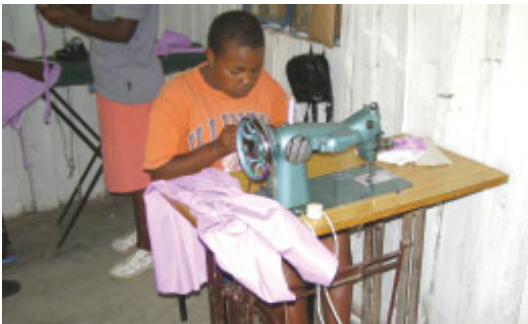
Elev på skolen

Vi har to ansat til at sy skoleuniformer, så de koncentrerer sig om denne afdeling. Det er en glæde for os, at kunne blive selvforsynende med uniformer, og på denne måde hjælpe andre til at få et arbejde. Vi håber på at kunne sy uniformer til flere skoler med tiden.