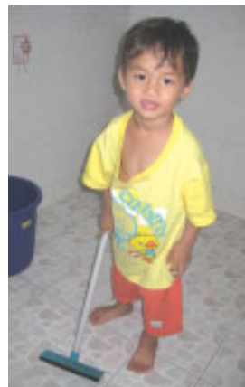
Lille Jojo på tre år

Frem til den 23. december vil jeg også selv modtage thai undervisning to timer hver dag på en sprogskole inde i byen Chiangmai, i håb om, at jeg måske en dag bliver i stand til at tale flydende thai. Forinden jeg kom hertil, boede jeg i Bangkok i 2 måneder, hvor jeg også studerede thai.