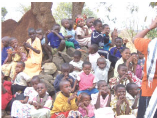
Søndagsskolebørn i Masailandet

Under gudstjenesten har de søndagsskole, som holdes under træerne. Børnene er delt op i 3 hold, da de er så mange og i alle aldre, hvilket er dejligt.