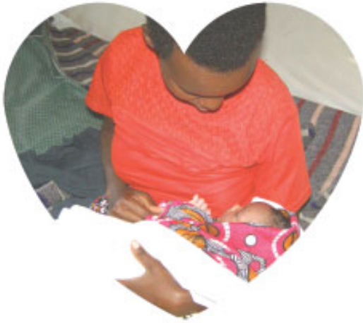
Ung mor på et af centrene med sit lille barn

piger store følger, hvis de vælger denne udvej. Vi ønsker at være med til at give liv, også til det ufødte barn. Det er fantastisk at følge sådan en ung mor komme ind på centeret, opgivende og fuld af uro for fremtiden. Se hende blive fredfyldt og få håb for fremtiden og ønske om at tage hånd om sit barn. Ja, det gør én glad, og giver lyst til fortsat at række ud til flere unge piger og prostituerede, som har tabt alt håb for fremtiden. Vi har set flere af disse piger blive forvandlet og få håb for fremtiden. En af pigerne er blevet gift, og mange er kommet til tro på Jesus. Det er jo den allerbedste beslutning, de kan tage. Der er mulighed for at komme i kirke og deltage i bibeltimer, hvis de ønsker det, medens de bor på centeret. Her er også skolegang og undervisning i forskellige aktiviteter samt salg af tasker og æg produceret på krisecentrene.