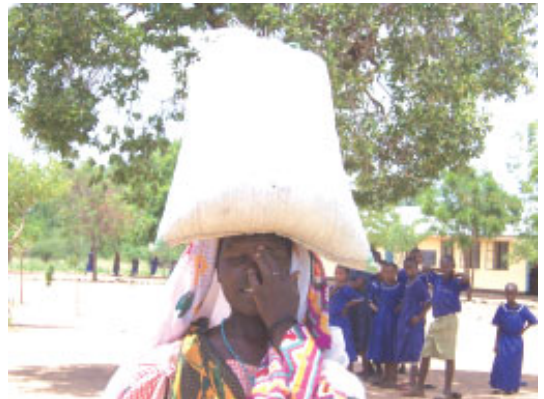
En mor græder af glæde over en sæk majs

Men situationen i 2005-2006 var anderledes på grund af en forfærdelig tørke, hvor vi uddelte mad i masailandet.