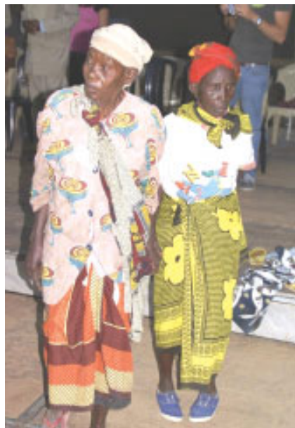
Du kan hjælpe !

Der er så mange, som har gjort dette muligt, og vi er så taknemlige for alle vore partnere. Gud velsigne jer!