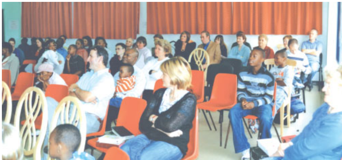
Udsnit af forsamlingen søndag formiddag

hed, vi har og altid har haft til at forkynde Evangeliet og uddele traktater på gaden. Tusinder af traktater bliver delt ud hvert år, og det er en sjældenhed at finde nogen, der er smidt på gaden. I årenes løb har en hel del mennesker vidnet om, at det netop var en traktat, der førte til, at de tog deres første skridt på vejen til Jesus.