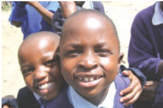
Skolebørn i Filadelfia New Life School

De største børn i børnehaveklassen, har snart deres store dag, hvor de bliver færdige med børnehaveklassen, og skal rykke op i første klasse. Det foregår med en stor ceremoni, hvor de har specielle dragter på, og hvor alle får et diplom. Lærerne og personalet gør et