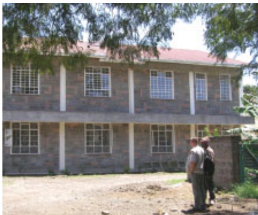
Det nye pigehus - næsten færdigt

Vi glæder os over, at vi nu er kommet så langt med byggeriet, og køkkenet er ved at blive installeret. De sidste ting er ved at være i orden, og meget snart, skal vi have syet gardiner, og pigerne kan gøre sig klar til at flytte ind. Men vi mangler flere penge, cirka 60.000 kr. for at kunne gøre det helt færdigt. Tak om I vil være med til at bede om, at disse penge må komme ind, så vi kan få disse piger ind under pragtfulde forhold. Huset er et mirakel, og vi takker Gud for hver enkelt, som har været med til at gøre det muligt.