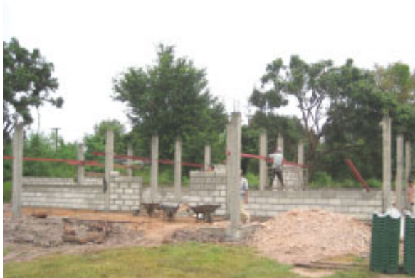
Et nyt hus tager form på 'Asia's Hope'