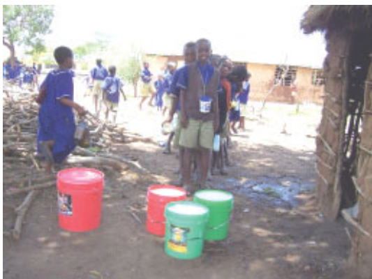
Børnene får hver en bøtte med vælling

Nødhjælpen har ikke alene forårsaget at folket kunne overleve, men rigtig mange har oplevet Guds kærlighed gennem dette og søgt hen til den lille lokale pinsekirke, hvor flere har givet deres liv til Jesus.