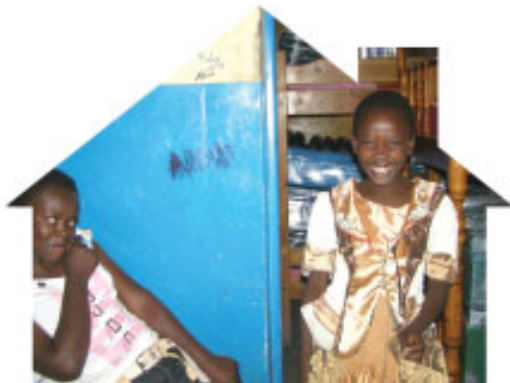
Nogle af pigerne fotograferet i det gamle hus

På New Life Boys home bor der nu 46 drenge som alle har behov for hjælp og omsorg, og vi ser hvordan de ændrer sig og bliver forandret. Der er en stor aldersspredning på drengene, hvor de små er 6 år og de ældste 19 år. De store går på kostskole, så de er dog kun hjemme i ferierne i april, august og december. Vi har planer om at få bygget et større hus til drengene, hvor vi for fremtiden kan dele dem op i forskellige aldersgrupper. Du kan være med til at bede for dette hus, at det må komme til at blive en virkelighed.