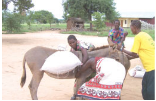
Kvinderne bruger æslerne til at bringe majs hjem