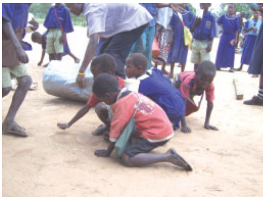
Ikke en krumme går til spilde

Kirken er en gammel faldefærdig jordhytte og taget er utæt. Når det regner er det nødvendigt at aflyse gudstjenesten, da taget er lavet af græs så det regner ned.