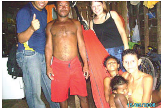
På besøg med DTS hos en familie i slummen

Jeg elsker at være her, med alle vanskelighederne, og der er mange. Jo flere vanskeligheder, jo mere oplever jeg af Gud. Cirkusturneen blev for mig et stort vidnesbyrd om Guds beskyttelse. For kort tid siden brød en tyv ind på værelset, hvor jeg bor. Det var natten før, jeg skulle forny mit visum med yderlige 3 måneder. Jeg havde oplevet ret voldsomme ting på det sidste, som et tegn på at Satan ikke vil have mig her. Men Halleluja, alt var i Guds hånd, og da jeg vågnede om morgenen efter at være berøvet, kunne jeg ikke andet end at takke Ham. Jeg havde om aftenen følt, at jeg ikke burde sove på mit værelse, at der ville ske noget, så jeg sov et andet sted. Hvis jeg