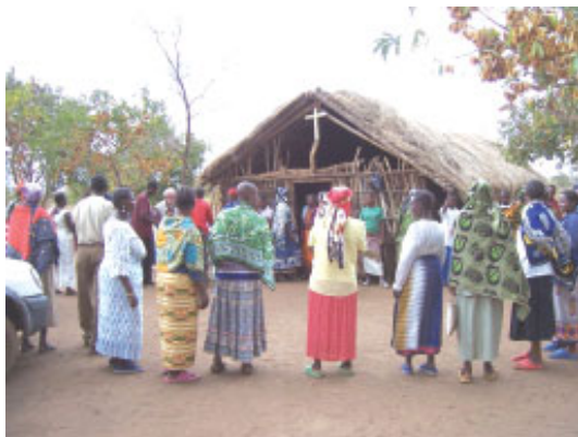
Den primitive Masaikirke

Kirken er en gammel faldefærdig jordhytte og taget er utæt. Når det regner er det nødvendigt at aflyse gudstjenesten, da taget er lavet af græs så det regner ned.