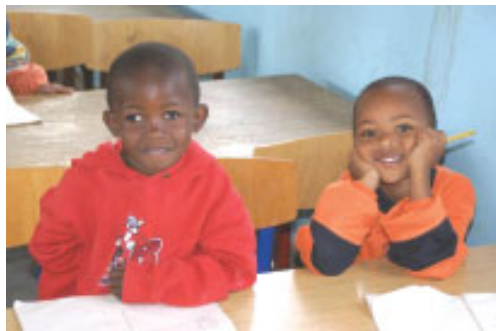
Hvordan bliver deres fremtid?

Bibelskolen nærmeste eksploderer, og børneskolen NLA blomstrer, og børnehjemmet Hayley's House er nærmest indflytningsklart.