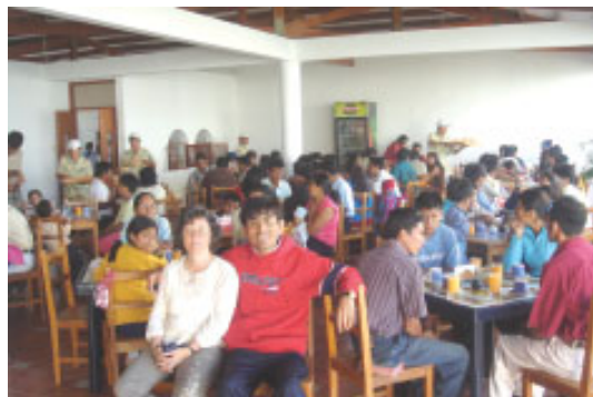
Morgenspisning på pastorleiren