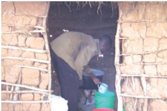
Her laves majs vælling til skolens børn

Nødhjælpen har ikke alene forårsaget at folket kunne overleve, men rigtig mange har oplevet Guds kærlighed gennem dette og søgt hen til den lille lokale pinsekirke, hvor flere har givet deres liv til Jesus.