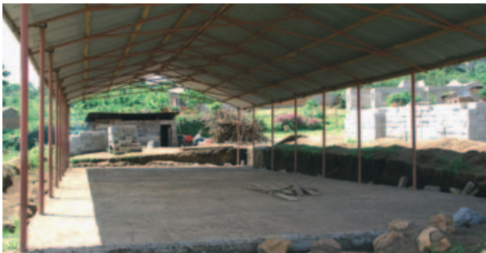
Nylagt betongulv i den nye spisesal