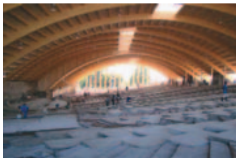
Så langt var arbejdet fremme februar/marts 2009

Hemmeligheden bag at det er gået så godt med at komme i gang med arbejdet er, at mange kristne har stået sammen om det, og i enhed ligger der altid Guds velsignelse, enten det drejer sig om de materielle eller de åndelige sider af evangeliet. Tak til alle jer som på én eller anden måde har været med til at hjælpe. Vi ønsker vore brødre i Sydafrika tillykke med, at de i påsken kunne indvie hallen, selvom der er flere mindre detaljer, som mangler.