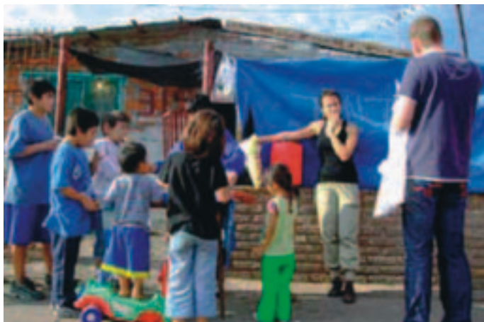
Børnekirke i slumkvarteret 'Puerta 8'