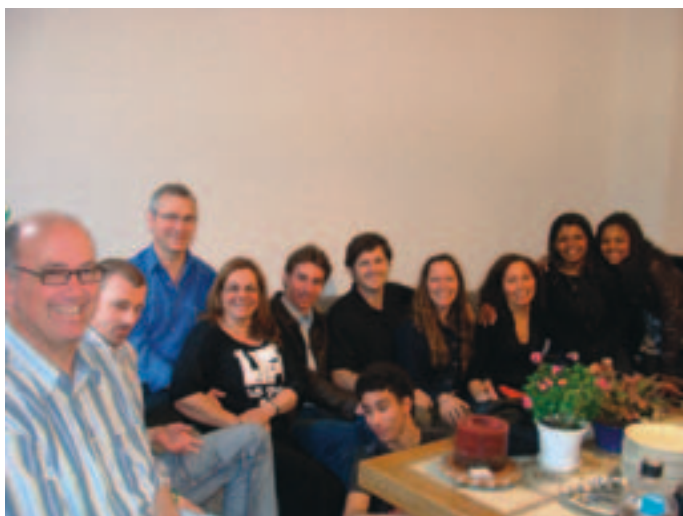
Billede fra en kredssamling

Allerede i den tidlige start opdagede vi, at de fleste af disse mennesker havde en marginaliseret tilværelse i samfundet. Uden tilstrækkelige sprogkunderskaber og faglige kvalifikationer er de tvunget til at tage de jobs, ingen tysker ville tage. Også på alle andre områder har de brug for støtte, sygeforsikring, job- og boligsøgning, offentlige institutioner, arbejdsmarkedet og selv med deres partnere, må de tit overstige store forhindringer.