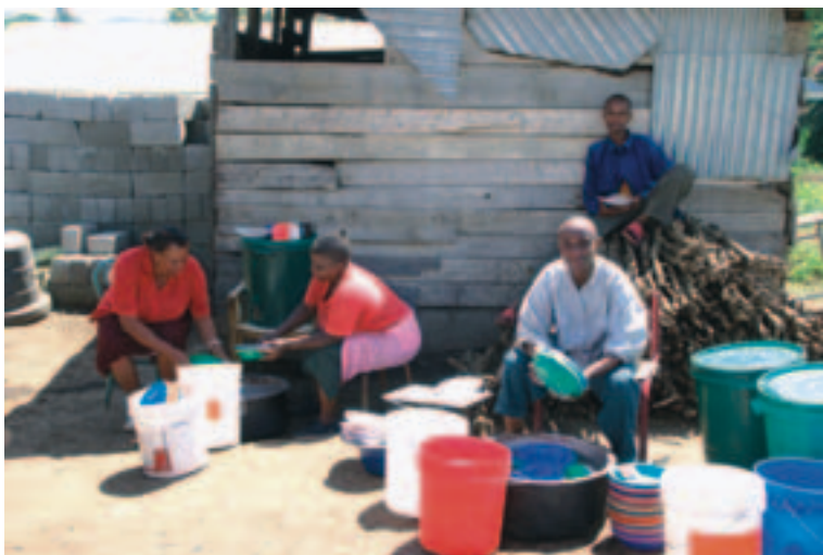
Et nyt køkken er tiltrængt

Vi er så glade for, at vi alligevel ikke aflyste nogle af vore mange planlagte aktiviteter på grund af økonomisk håbløshed i begyndelsen af dette år. Vi var så hårdt prøvede, at vi menneskelig set ikke kunne se anden udvej end at skære ned – dog med frygt og bæven valgte vi at tro på Gud og Hans trofasthed.