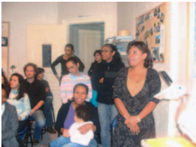
Der synges lovsang ved gudstjenesten

Vi mødes til søndagsgudstjeneste i vores hjem, hvor vi har et specielt rum dedikeret til dette formål samt for de ugentlige bibelstudier. Ved siden af dette holder vi evangelisationskampagner, weekend-seminarer o.s.v.