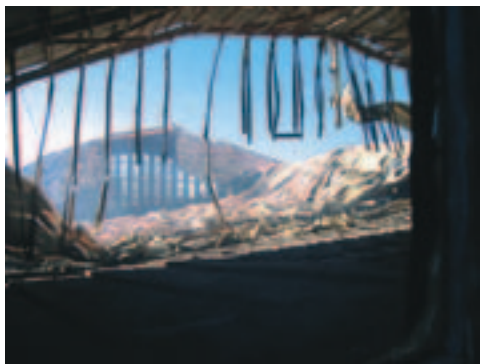
Hallen udbrændte 14 juni 2008

Det er med glæde vi kan melde at genopbygningen af den store mødehal i Syd-Afrika skrider frem. De bærende elementer blev sejlet fra Europa og er nu på plads. Som det fremkommer af billederne er der mange ting som endnu skal gøres og det er fortsat behov for støtte. De som vil hjælpe med bidrag kan fortsat sende midler til Missionsfonden