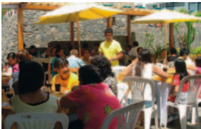
Det er ren forkælelse på familielejren, men de fortjener det!

Men det er stadig familielejren i august, som er den store udfordring. Jeg sad og læste i bibelen på hverdagsdansk, hvor de, der har gjort Guds vilje, siger: „Herre, vi har da aldrig set dig sulten og givet dig noget at spise, eller tørstig og givet dig noget at drikke. Vi har da heller aldrig set dig stå fremmed og budt dig velkommen, eller set dig stå uden tøj og skaffet dig noget. Vi har da aldrig set