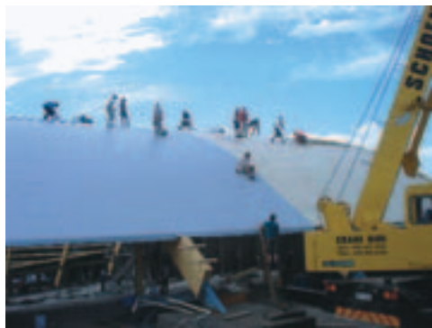
Tagdækningen lægges på