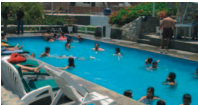
Der slappes af i swimmingpoolen