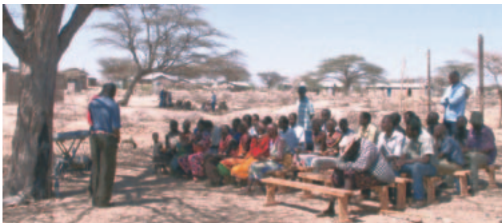
Den gamle 'kirke' i Marsabit bestod af bænke under åben himmel

Den sudanske biskop takker alle, som har været med til at give til projekterne og ønsker Guds velsignelse over dem. Det var nogle af mid-