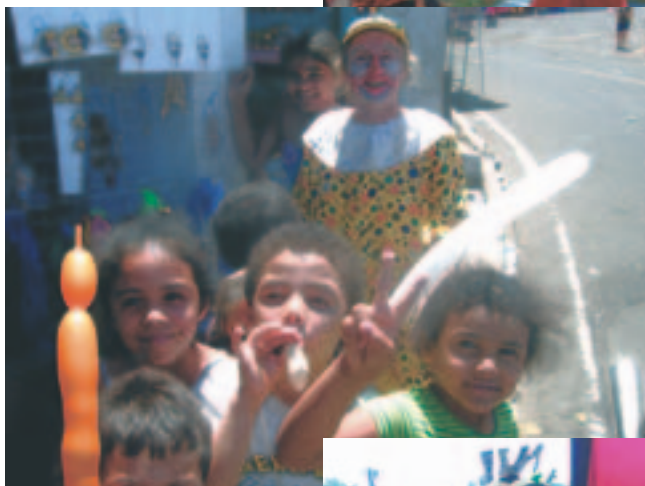
Klovn der laver ballonfigurer