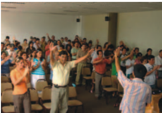
Familielejrens deltagere til gudstjeneste

Jeg kunne se, hvordan disse ord bare siger 'JA' til sådan en lejr! Det er Guds hjerte! Jeg ved, at mange af dem, som vil være på den lejr, ofte