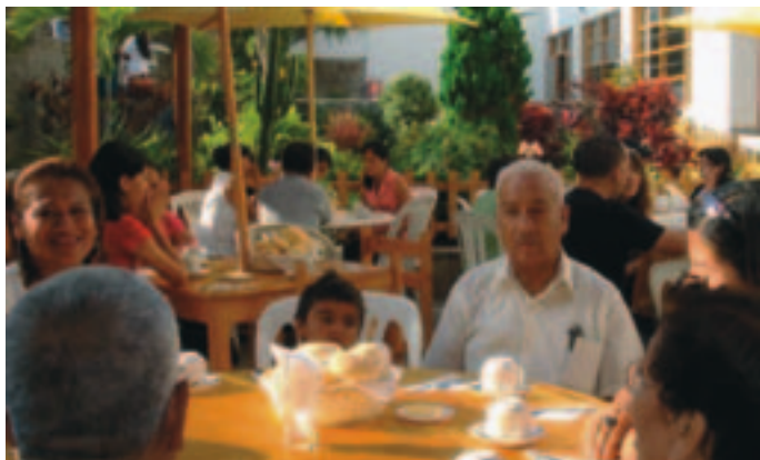
Også morgenmåltidet nydes i grupper

følt sig oversete, selv om de tjener Herren! Men de er ikke oversete! De fleste er for mig også ukendte – men ikke for Herren! Han har set dem!